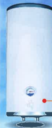
เครื่องผลิตน้ำร้อนไฟฟ้า แบบหม้อต้ม (Electric Water Heater)