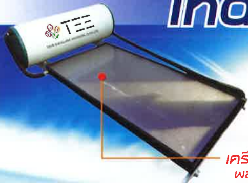
เครื่องผลิตน้ำร้อน พลังงานแสงอาทิตย์ (Solar Water Heater)