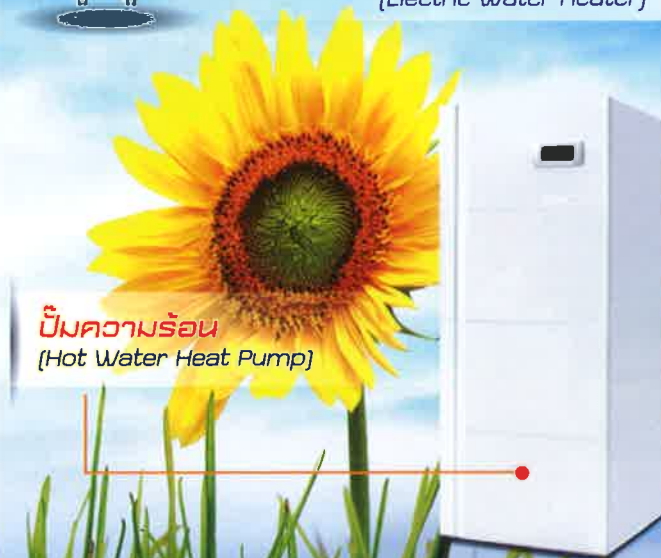
ปั๊มความร้อน (Hot Water Heat Pump)