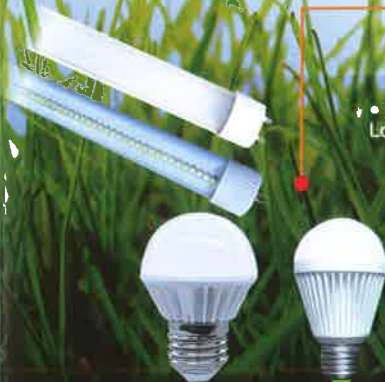
LED (Light Emitting Diode)